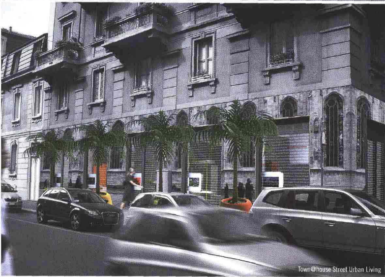
Town@house Street Urban Living