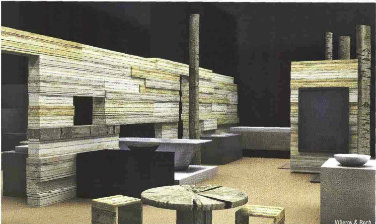
Villeroy & Boch